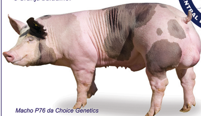
Macho P76 da Choice Genetics

Doses e mini doses (inseminação intrauterina ou pós-cervical) de sêmen suíno resfriado de raças puras (Landrace, Large White e Duroc) e de todos os programas genéticos: Agrocercos PIC, Choice Genetics, Topigs Norsvin e Granja Balduíno.