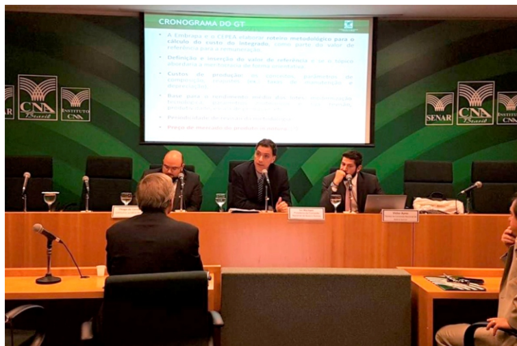
Reunião discutiu metodologia de remuneração dos produtores integrados

Desde que foi sancionada, em maio de 2016, a Lei de Integração determinou que o GT deveria buscar fundamentos técnicos e acadêmicos a fim de apresentar melhorias nas relações contratuais. Até o momento, o grupo já se reuniu três vezes para definir cronograma e debater outros