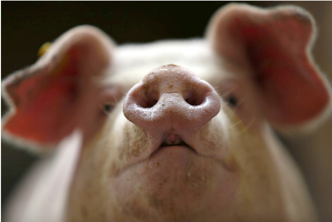
Suinocultura gaúcha conta com aproximadamente 8 mil criadores