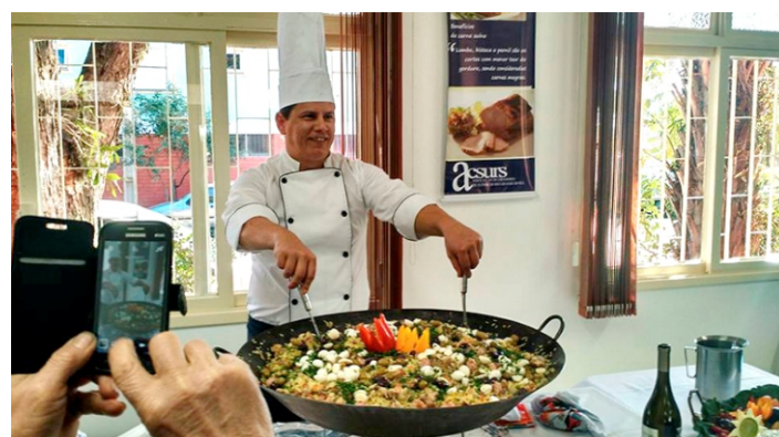
Cheff responsável pelo preparo dos pratos servidos no almoço