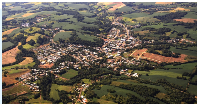
Rondinha está entre os maiores produtores de suínos do Estado