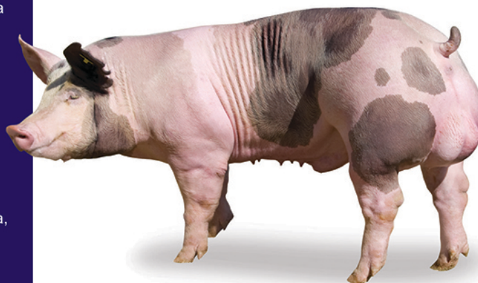
Macho P76 da Choice Genetics