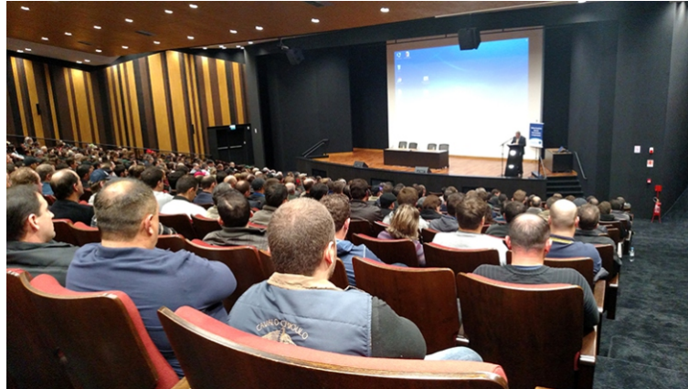
1º Encontro Técnico da Suinocultura contou com público de cerca de 600 pessoas

Uma das revelações do evento foi que o Brasil apresentou, na assembleia da Organização Mundial da Saúde em Genebra, no final de maio, o Plano Nacional para Prevenção e Controle da Resistência aos antimicrobianos. Nos próximos dias começa o envolvimento dos atores para a operacionalização do planejamento estratégico nas áreas de saúde