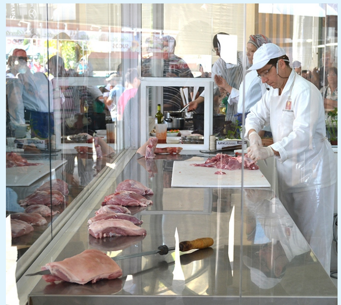
Consultor apresenta cortes da carne suína

As carcaças de carne suína foram oferecidas pelas cooperativas Languiru, com sede em Teutônia, e Ouro do Sul - Cooperativa dos Suinocultores do Caí Superior, de Harmonia. A ACSURS é apoiadora da ação através do Projeto Nacional de Desenvolvimento da Suinocultura (PNDS), promovido pela Associação Brasileira dos Criadores de Suínos (ABCS).