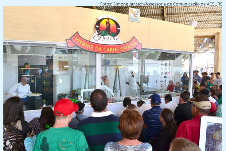
Público atento à Vitrine da Carne Gaúcha