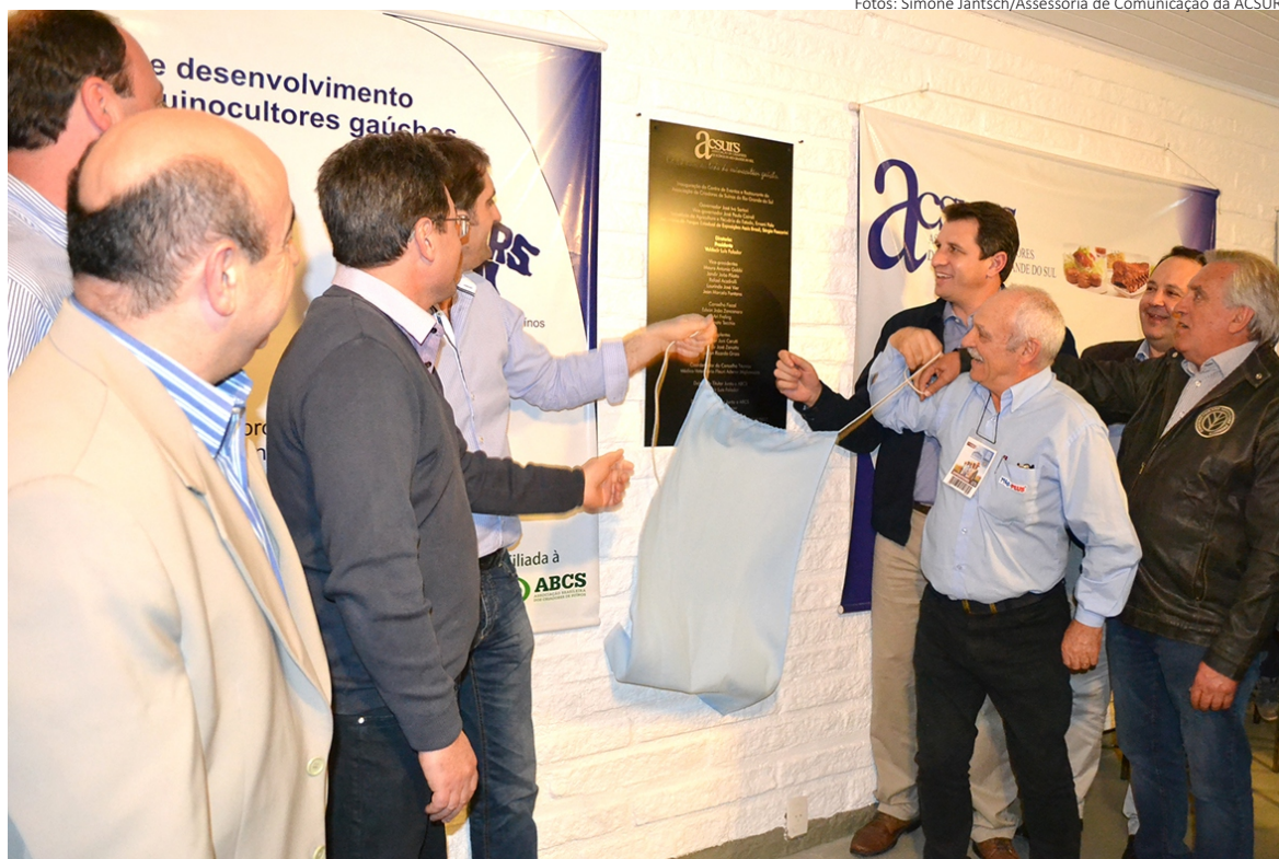
Secretário da Agricultura e Diretoria da ACSURS inauguraram o novo espaço da ACSURS dentro do Peeab