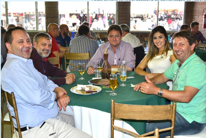
Diretoria da ACSURS prestigiou almoço da Nutrifarma/Nuscience e Topigs Norsvin