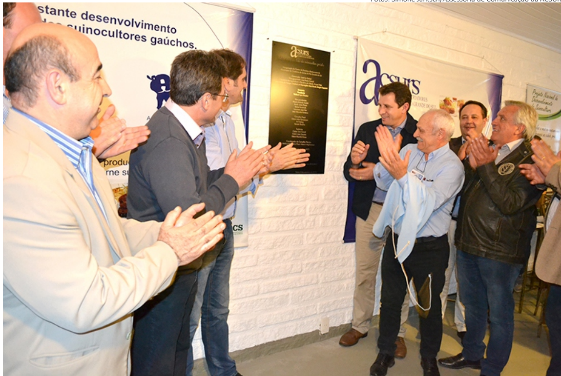
Ato de descerramento da placa inaugurou o novo espaço dos suinocultores no PEEAB