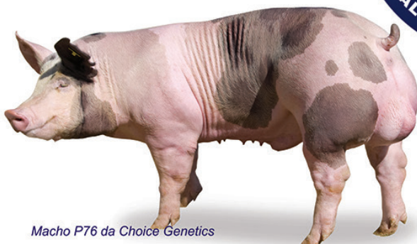
Macho P76 da Choice Genetics

Doses e mini doses (inseminação intrauterina ou pós-cervical) de sêmen suíno resfriado de raças puras (Landrace, Large White e Duroc) e de todos os programas genéticos: Agroceres PIC, Choice Genetics, DB Genética Suína, Topigs Norsvin e Granja Balduino.