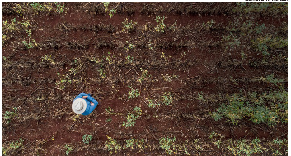
Estiagem atinge lavouras de milho e soja, principais insumos da alimentação do suíno, além de limitar o consumo de água dos animais

A entidade encaminhou documento que solicita aos órgãos competentes a possibilidade de melhorias ou criação de reservatórios em fontes ou nascentes de água que estão localizadas em Áreas de Preservação Permanente (APPs). Segundo o presidente da