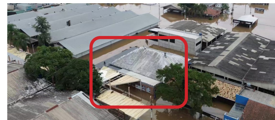
Sede e restaurante da ACSURS foram atingidos pela água. Ainda não há informações sobre os prejuízos causados, pois a água, ainda ocupa o espaço.

A decisão se dá por conta da dificuldade na entrega do informativo nas casas de milhares de suinocultores e profissionais do setor, já que os Correios, empresa responsável pela entrega, enfrenta problemas de logística causados pelas interrupções nas estradas.