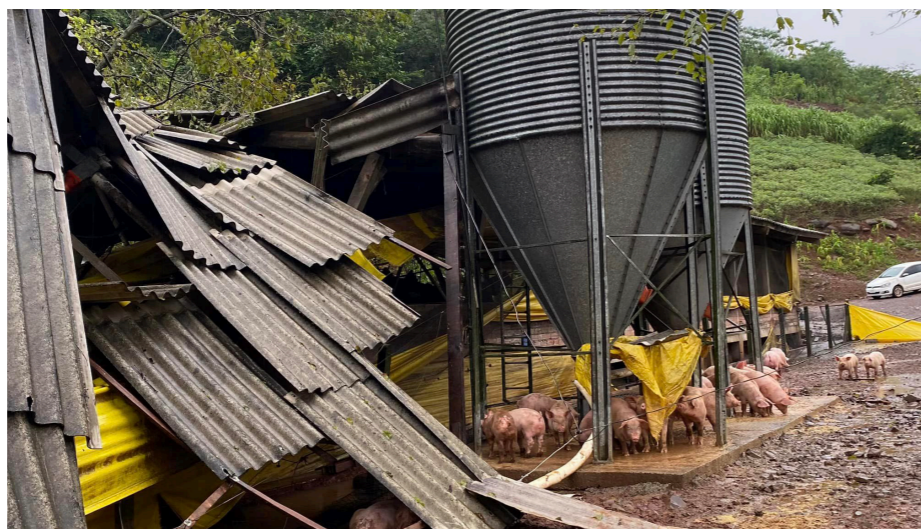
Em Tupandi/RS, uma granja teve sua estrutura comprometida e registrou a morte de animais depois de ser atingida pela enchente.

Com os dados ainda sendo contabilizados, a entidade ainda não tem os