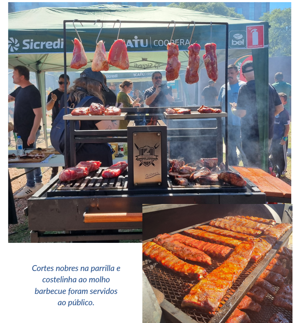
Cortes nobres na parrilla e costelinha ao molho barbecue foram servidos ao público.

“Aqui no Rio Grande do Sul, temos um consumo alto de carne suína, e por isso, nosso papel é diversificar o pre-