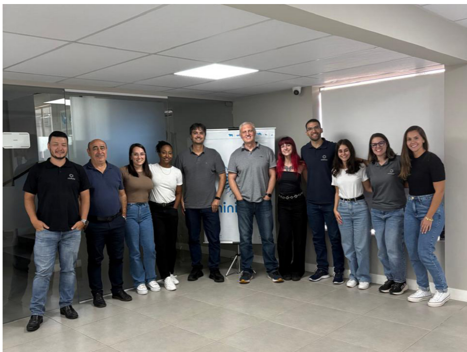
Parte da equipe do laboratório da CCPS participou, no início de fevereiro, de treinamento técnico com a Minitube, reforçando a qualificação e a qualidade dos processos.